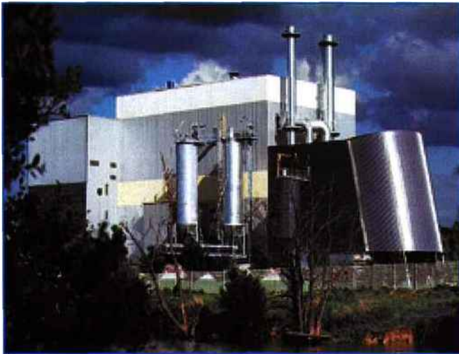
L'usine d'incinération de St Thibault des Vignes.

C'est en partenariat avec Novergie (groupe Suez) que Carl International et Eureka Flash Info ont présenté une conférence sur ce thème lors du dernier salon MaintenanceExpo. Compte rendu.